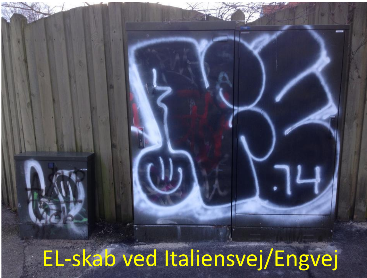
EL-skab ved Italiensvej/Engvej