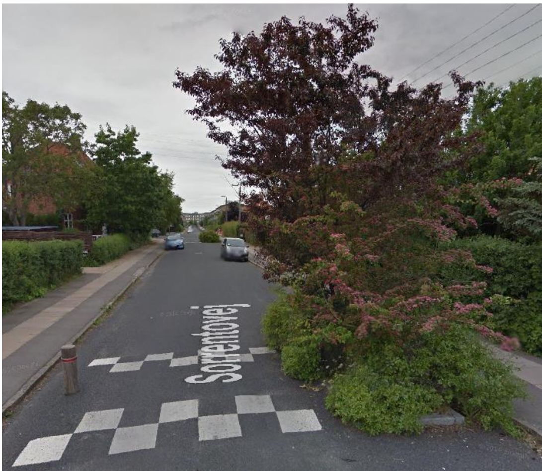
Figur 3: Vejbump ud for Sorrentovej 30/32. Bemærk at steleren mod vejbedet ikke er synlig.