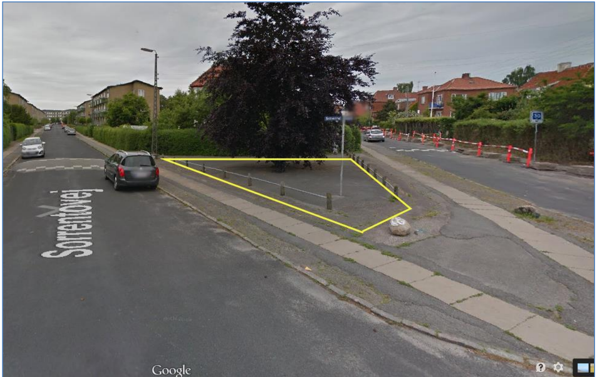
Figur 5: Arealet ved blodbøgene er markeret med gul streg.