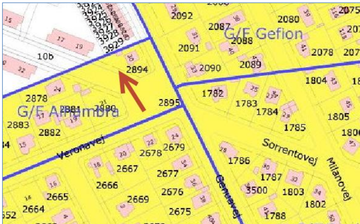
Figur 4: Arealet ved blodbøgene er markeret ved den røde pil.