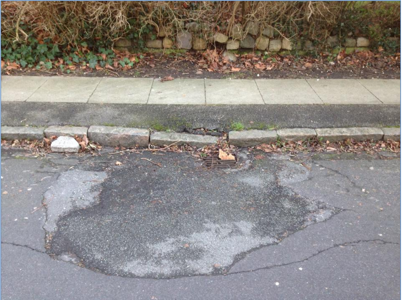
Figur 2: Kantsten udfald mod vejbrønd/vej på vores side af Engvej.

Kantstene har udfald mod vejen flere steder langs fortov. Eftersom grundejer (Øysteins, Sorrentovej 39) går med byggeplaner vil vi afvente byggeriet, da entreprenørmaskiner mv. må forventes at trykke/forværre udfaldet yderligere.