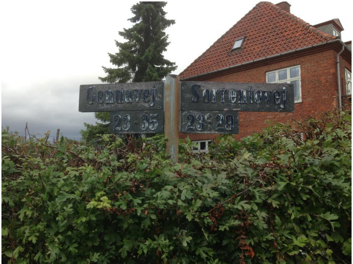
Figur 6: Vejnavne er meget svære at læse på vejskilte i krydset Genuavej/Sorrentovej.